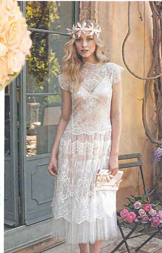
Rembo Styling 1.185 euro