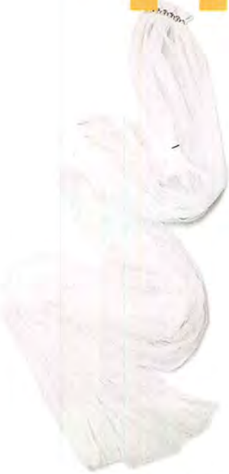
Sluier bezet met parels, Lanvin 1.150 euro