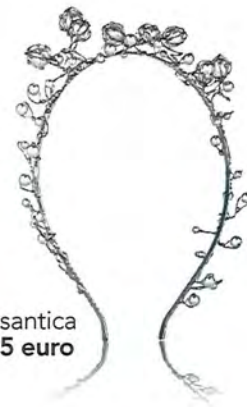
Rosantica 325 euro