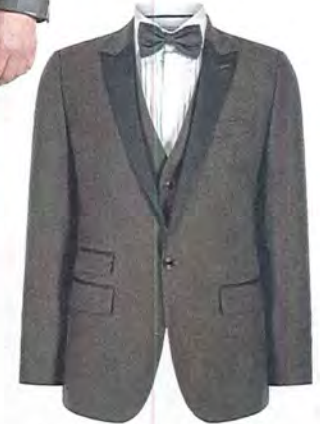
Tommy Hilfiger 429 euro