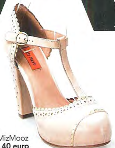
MizMooz 140 euro