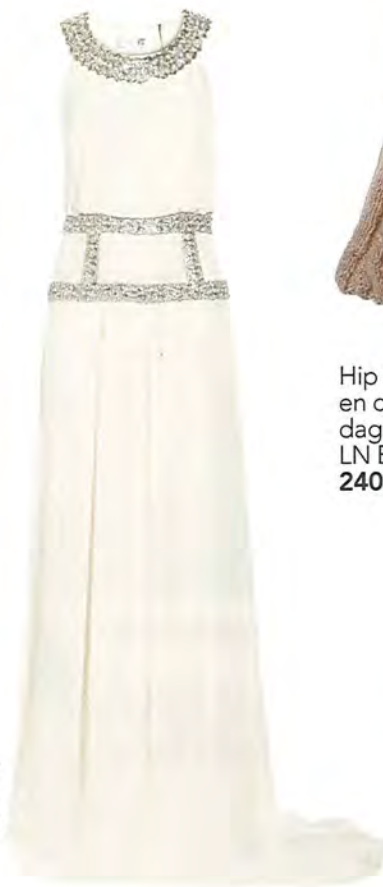
Temperley London 5.483 euro