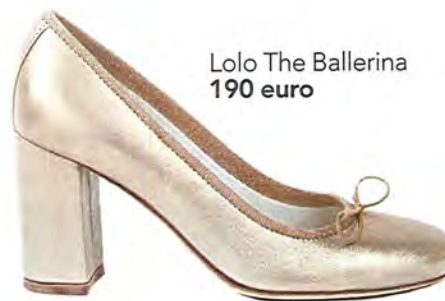
Lolo The Ballerina 190 euro