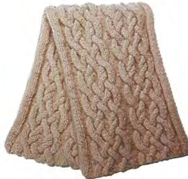
Hip bij bruidjes: gebreide sjaals en omslagdoeken om op koude dagen hun jurk op te vrolijken, LN Beanies 240 euro