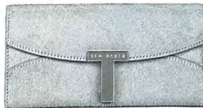
Ted Baker 110 euro