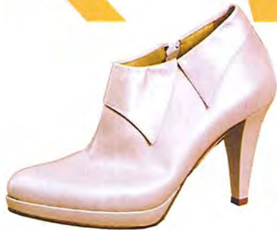
Linea Raffaelli 297,50 euro