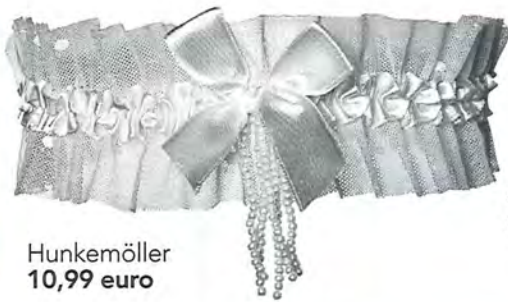
Hunkemöller 10,99 euro