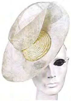
Awardt 180 euro