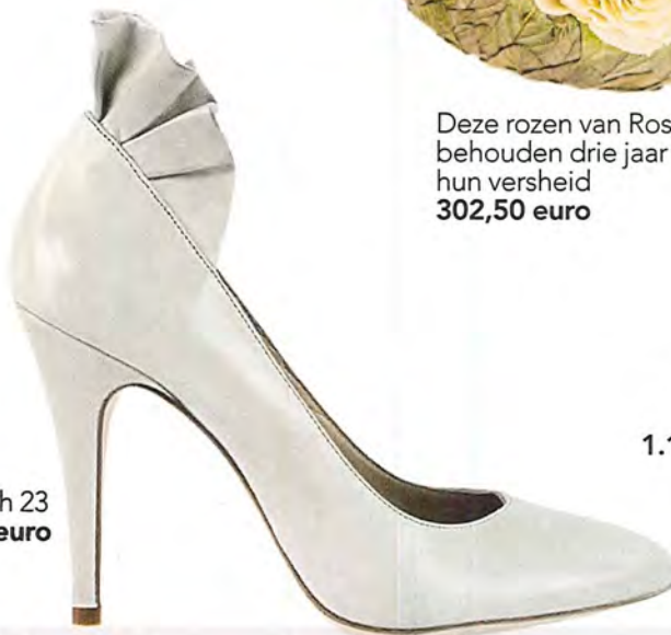
March 23 179 euro