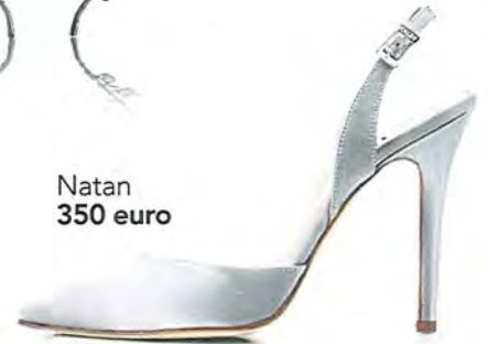
Natan 350 euro

JE TROUWDAG IS ZONDER TWIJFEL EEN VAN DE MOOISTE DAGEN UIT JE LEVEN. EENTJE WAARBIJ JE GARDEROBE OOK EEN FEESTELIJKE MAKE-OVER KRIJGT. WIJ ZETTEN ENKELE STUKKEN OP EEN RIJ DIE JE OMTOVEREN TOT EEN SPROOKJESBRUIDSPAAR!