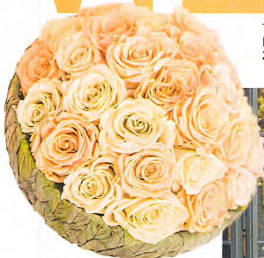
Deze rozen van RosaPiu, behouden drie jaar lang hun versheid 302,50 euro