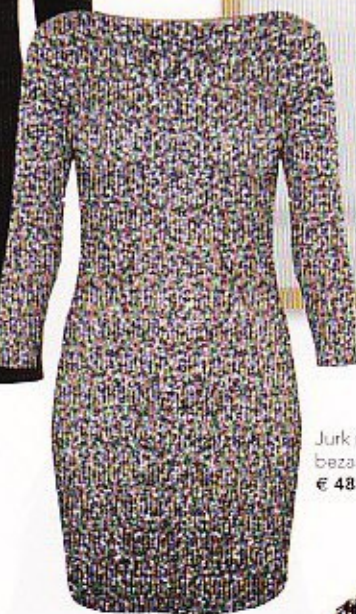
Jurk met driekwartsmouwen, bezaaid met strass en pailletten € 489, Ambre Babzoe