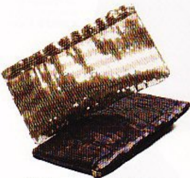
Clutch versierd met pailletten € 120, Gerard Darel