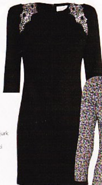
Getailleerde jurk versierd met Swarovski steentjes € 359, Vandenvos