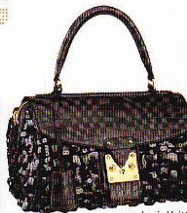
Louis Vuitton (prijs op a...