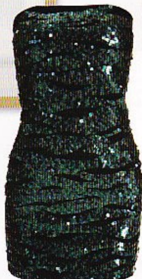
Zijden jurk versierd met steentjes € 250, Designers Remix Collection