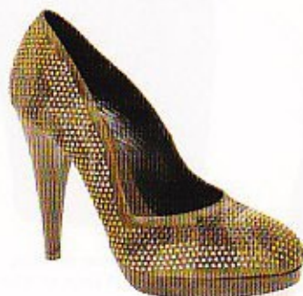
Pump met studs € 379, Vic Matie