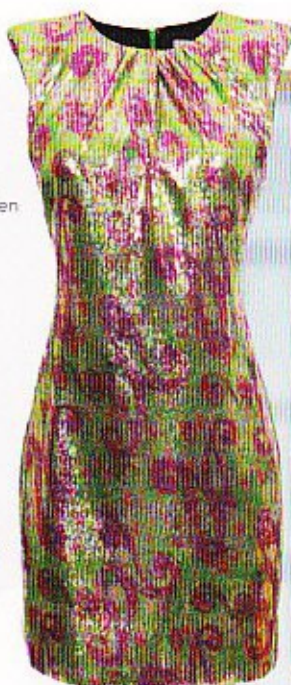
Glanzende kokerjurk met kleurrijke pailletten € 399,95, Gant