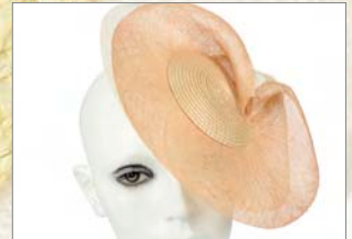
Awardt 9664 - 132€