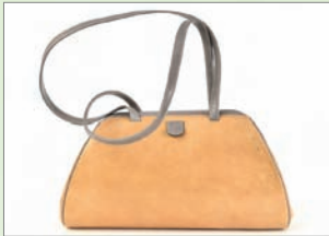
Awardt 8535 - 327€