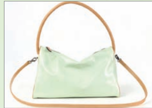
Awardt 8542 - 338€