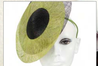
Awardt 8567 - 80€