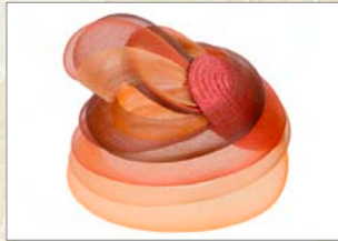
Awardt 9638 - 180€