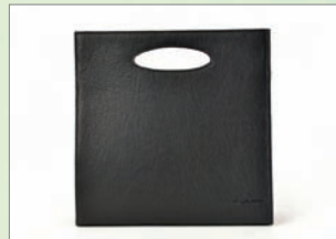
Awardt 8497 - 275€