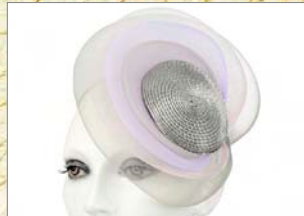
Awardt 9650 - 151€