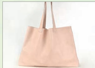
Awardt 8555 - 282€