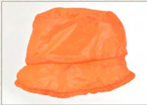
Awardt 8568 - 80€