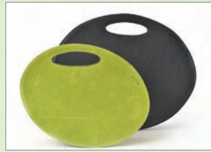
Awardt 8485 - 312€