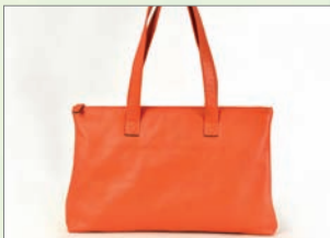
Awardt 61045 - 255€