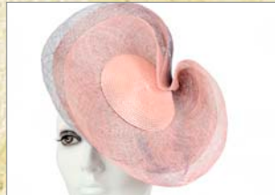
Awardt 9657 - 154€