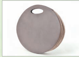
Awardt 8510 - 468€