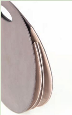
Awardt 8501 - 290€ - 340€