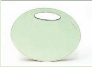
Awardt 8513 - 468€