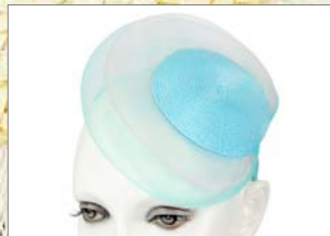
Awardt 9642 - 151€