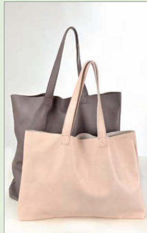
Awardt 61051 - 318€