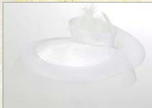
Awardt 9660 - 147€