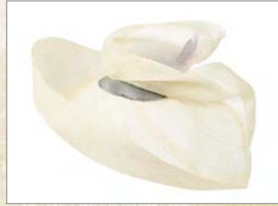
Awardt 9673 - 175€