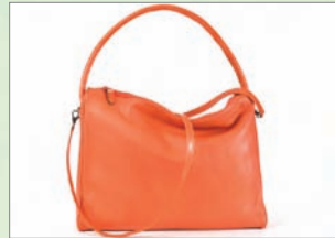
Awardt 8495 - 273€