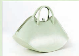
Awardt 8525 - 372€