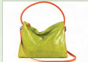
Awardt 8556 - 282€ - 255€