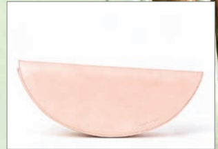
Awardt 8529 - 410€