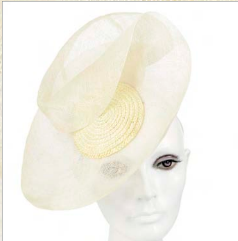
Awardt 9646 - 159€