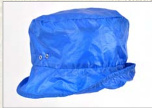
Awardt 8571 - 80€