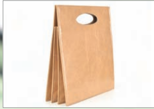
Awardt 8515 - 415€