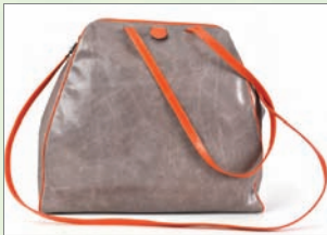
Awardt 8540 - 338€