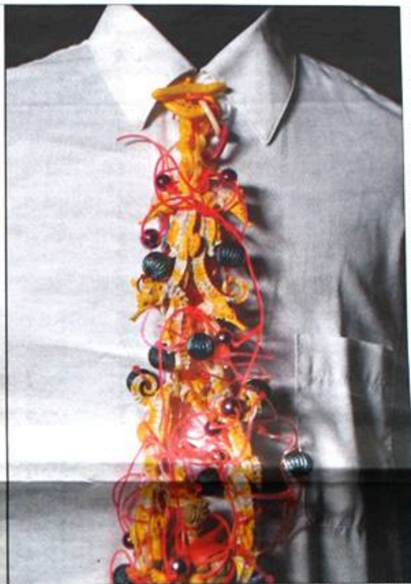
Weinberger. Een kleine selectie uit de expositie.