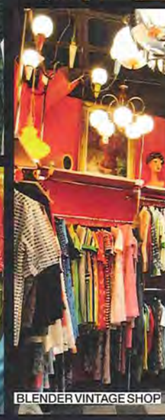
BLENDER VINTAGE SHOP