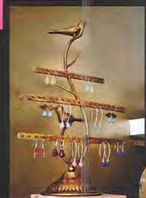
SIMPLE COMME BONJOUR