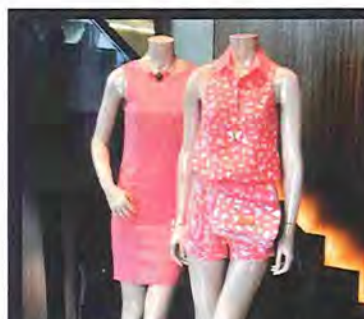
HISTOIRES DE FEMMES