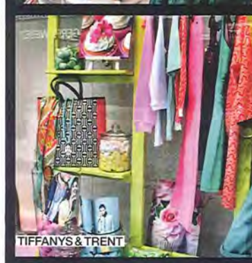
TIFFANYS & TRENT