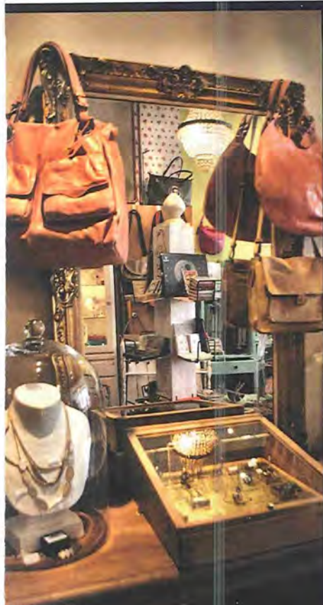
TE DU CHEF