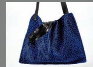
Animal 36 - 287€