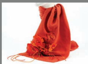
Animal 14 - 70€