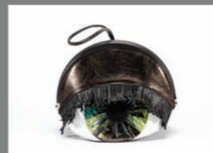
Animal 24 - 318€