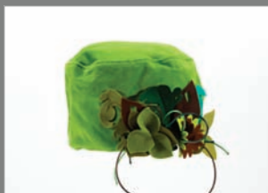
Animal 07 - 60€