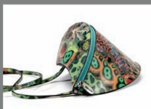
Animal 28 - 230€