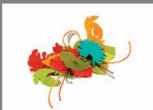
Animal 19 - 15€