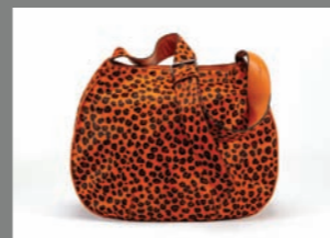
Animal 32 - 405€