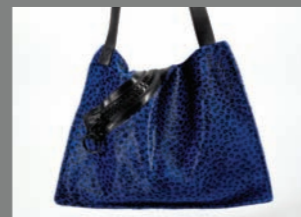
Animal 36 - 287€