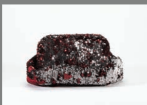
Animal 34 - 182€