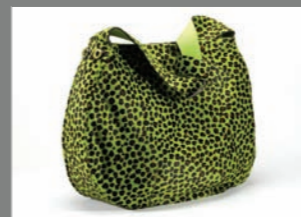
Animal 33 - 542€