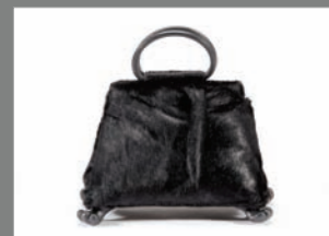
Animal 27 - 605€