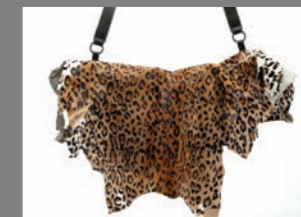
Animal 37 - 287€