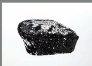
Animal 05 - 212€