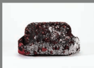
Animal 34 - 182€