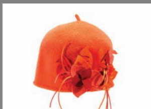
Animal 10 - 30€