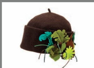
Animal 11 - 30€