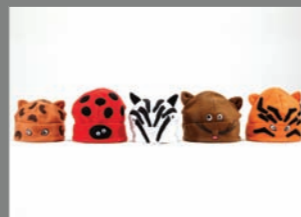
Animal 20 - 35€ - 37€