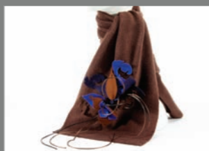
Animal 15 - 65€