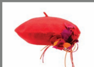
Animal 09 - 30€