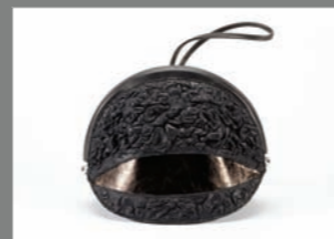
Animal 23 - 273€