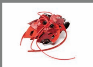
Animal 17 - 75€