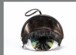
Animal 24 - 318€