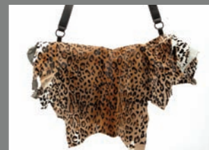
Animal 37 - 287€