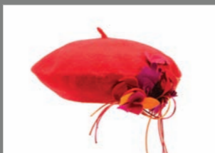
Animal 09 - 30€