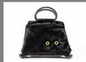
Animal 26 - 605€