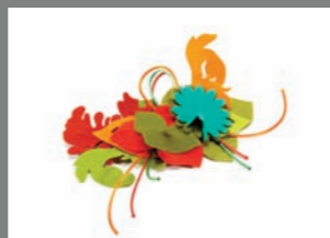
Animal 19 - 15€