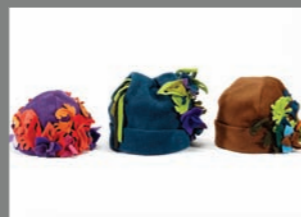
Animal 21 - 35€ - 37€