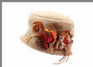
Animal 12 - 40€