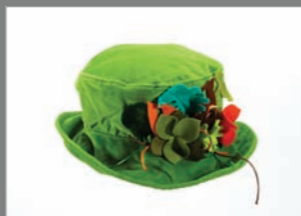
Animal 08 - 95€