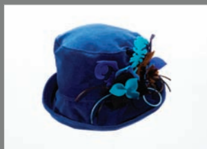
Animal 06 - 92€