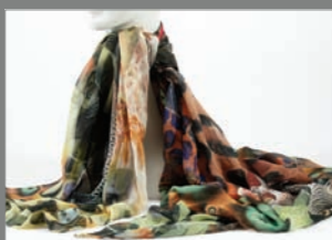
Animal 16 - 325€