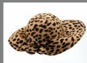
Animal 02 - 240€