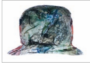
MMFC0028 - 59€