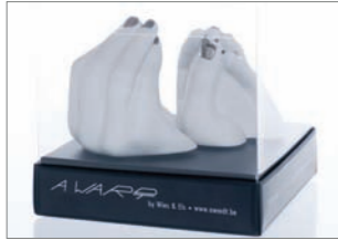
MMFC0071 - 500€