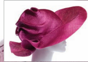
MMFC0017 - 180€