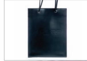
MMFC0055 - 300€