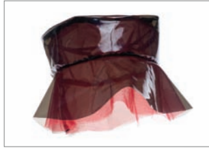
MMFC0018 - 119€