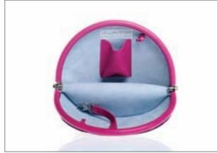
000MMFC0070 - 247€