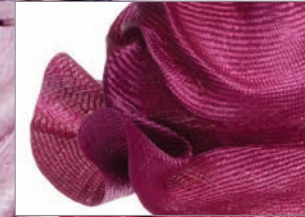
000MMFC0045 - 247€