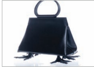
000MMFC0073 - 390€