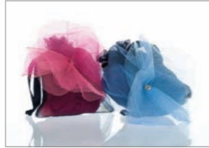
000MMFC0039 - 575€