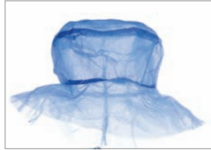
MMFC0024 - 59€