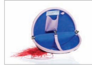
000MMFC0057 - 663€