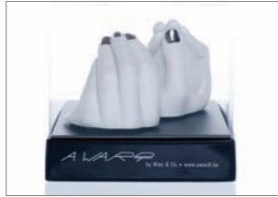
MMFC0074 - 500€