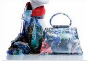
MMFC0047 - 67€