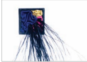
MMFC0048 - 325€ - 390€