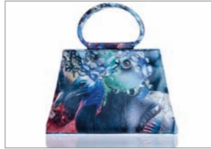
000MMFC0072 - 663€ - 575€ - 245€