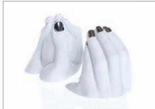
MMFC0079 - 500€