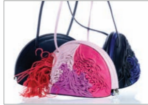
MMFC0003 - 190€