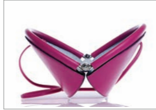
000MMFC0033 - 245€