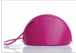
000MMFC0066 - 247€