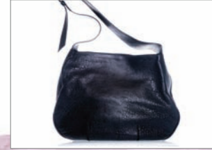
000MMFC0081 - 743€