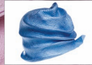
MMFC0015 - 197€