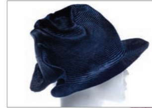
MMFC0007 - 197€