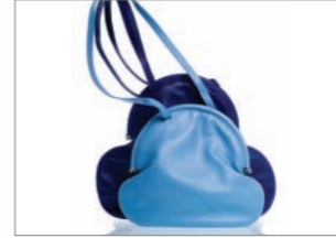
000MMFC0010 - 352€