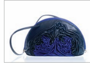
000MMFC0053 - 663€