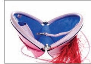
MMFC0030 - 65€