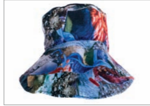
000MMFC0031 - 282€