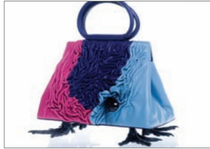
000MMFC0076 - 420€