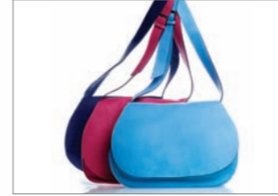
000MMFC0085 - 310€ - 280€