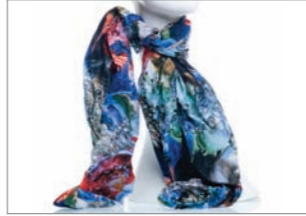
MMFC0014 - 97€